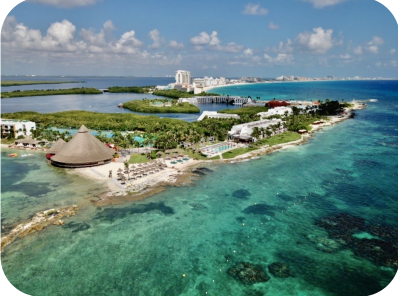
Club Med Cancún - Cancun (CUN) -

01/08/2026 - 15/12/2026 Superior Todo Incluido